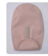
消臭パウチカバー

セラミックスが臭いを素早く吸着し、金属イオンが強力に分解するストーマケア消臭製品「インドールクイック瞬感消臭」「消臭パウチカバー」「消臭はらまき」は、排泄物の臭いや腸内ガスの臭いの主成分であるインドールの94%、硫化水素の85%を30秒で消臭する優れたモノです。