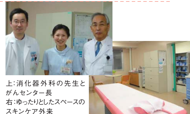
上:消化器外科の先生とがんセンター長 右:ゆったりとしたスペースのスキンケア外来

以前はストーマ造設術にだけ関わっていた医師も、今は手術前から関わり、患者さんを支える体制ができてきているという。がんセンターがこうした体制を作ることができた背景には、公開セミナーを通じ医師や看護師がストーマケアに対する意識を高め、知識を深めていった点が大きい。がんセンターのスキンケア外来は週に3日実施されている。1回1時間ほどで、1時間半かけることも少