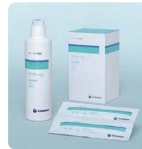
デオール消臭潤滑剤

コロプラスト株式会社から発売されているデオール消臭潤滑剤は植物性天然消臭成分(柿渋エキス)が、高い消臭効果を発揮し、潤滑成分が排出をスムーズにすることで、とくに夏場の臭い対策として最適な毎日をサポートします。小分けになったミニパックは、おでかけのときにかばんに入れておくことができる安心の一品です。