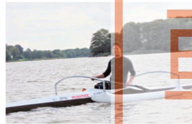
ICF パラカヌー ワールドチャンピオン大会 期間中の風景