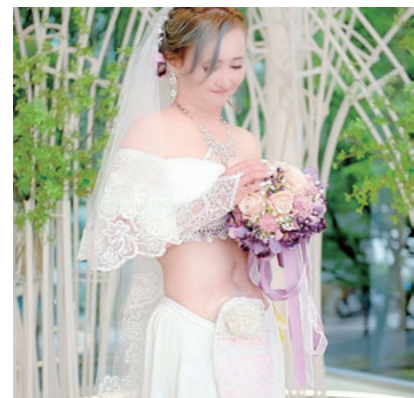
ご自身で制作されたパウチカバーをつけたウエディングフォト

その背景には、「パウチと生きる人生をポジティブにカラフルに」したいという想いがありました。今回は、パウチの飾り方を提唱される3人の若い女性オストメイト・アーティストのストーリーと、イベントでの「デコパウチへのお誘い」対談コーナーのレポートをご紹介します。