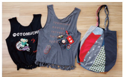
洋服をリメイクした通院バッグ