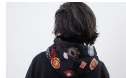
ご自身で裁縫されたパーカー

とを思いつきました。「久留米かすり」は濡れても乾きやすく、使えば使うほど馴染む手ぬぐい生地です。消臭・抗菌効果があるので、パウチカバーにはピッタリかなと思っています。今は持病の治療や、カテーテルの交換も行っているため、体調を見ながらパウチカバーを作り、今後は、通院している病院のがんサロンと病院裏の薬局で商品サンプルとチラシを置かせてもらう予定です。私自身もパウチカバーをつけて病院に通っていますが、その度に先生や看護師が興味を持ってくれます。嬉しいような恥ずかしいような気持ちです。