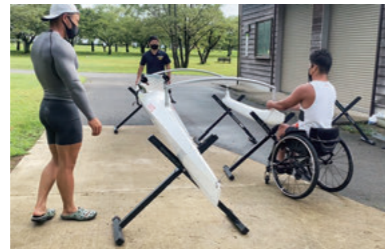
ボートを整備中の風景