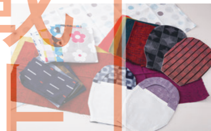
久留米かすりのカバー

私の場合、ボーエン病が病変異して広範囲の有棘細胞がんになり、尿道にもがんが見つかった為、広範囲の切除をし、ストーマを造りました。パウチカバーを作り始めたきっかけは、入院中に先生や看護師にパウチを見られることが恥ずかしく思えたからでした。入院