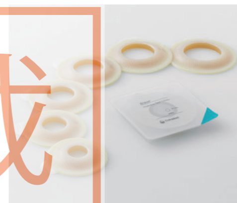
ブラバ プロテクティブ シール コンベックス

ブラバ プロテクティブ シール コンベックスは①吸水性と②耐久性に優れたプロテクティブ シールシリーズから出た凸面タイプです。柔らかく、③伸縮性もあるので、不正円形のストーマにも使いやすいのも特徴的です。④また貼付してから肌に馴染むまでの時間が