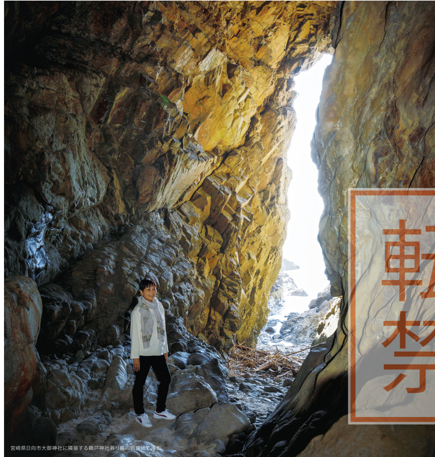
宮崎県日向市大御神社に隣接する鶴戸神社昇り龍の岩窟にて撮影