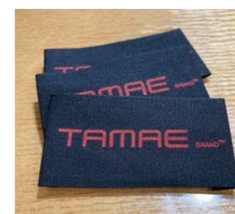
『TAMAE BRAND タマエ ブランド』ブランドタグ

ストーマ造設前はためらいがありましたが、もともと楽道家な性格も相まって、造設後は前向きにストーマケアに取り組んでいます。健常者も排便しますが、私たちは出る場所が違うだけです。汚いと感じたことはありません。しかし、気持ちが進まない方やパウチカバーを知らない方も多いと思います。術後ケアのまま、ガーゼやタオルケアのままの方もいらっしゃるよ