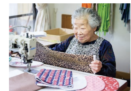
最近は和柄に加えてファッションブルな柄にも挑戦中!

ナースさんに見せたところ、布地の和柄に関心を持ってもらい、良い柄と評価をいただきました。「和柄、海外で受けるかも」「『TAMAE BRAND タマエ ブランド』良いかも!」との事で盛り上がり、これが『TAMAE BRAND タマエ ブランド』誕生の瞬間でした。その後、担当されている患者様へパウチカバーのサンプルをお配りし、お使いいただけるよう進呈しました。現在は和柄をはじめとして、さまざまな模様の布地を用いてパウチカバーを製作し、オンラインサイトにて販売しています。Instagram