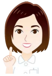
コロプラスト所属 皮膚・排泄ケア認定看護師

まだまだ寒い日が続きますね… 冬の寒さが厳しい日は、ストーマケアにも特有の悩みが出やすくなります。 例えば、 ストーマ装具の面板がなかなかお腹に貼り付かない。 やっと貼れたと思ったら、密着不良で漏れてきた… こんな経験はありませんか？