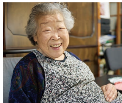
素敵な笑顔で、たくさんのお話を聞かせてくださる様子

もともと楽道家なので切り替えは早い方です。オストメイトになってからの生活の変化としては、泊まりがけの旅行や銭湯に行く機会が減りました。自宅にはもともとお風呂がありませんでしたが、兄が改築の際にお風呂の設置を強く勧めてくれました。その後、お風呂の暖房機を設置しました。装具交換に1時間かかることもあり、暖房があるお風呂は大変ありがたいです。私には子どもはおらず、甥が家から2時間のところに住んでいます、