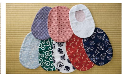
裏地までこだわりの多彩な柄の作品

うです。少しでも私の経験やパウチカバー作りが、同じ境遇の方の励みや参考になれば嬉しいです。ストーマがあるからこ