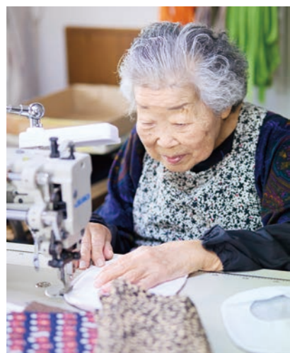
ご自宅の作業場には、2台のミシンと豊富な生地や素材が

子どもの頃から腸が弱く、たまに腹痛を感じることはありましたが、大きな異変には気づきませんでした。ストーマ造設のきっかけは意外なところからでした。白内障の手術後、調子に戻らなかったときに甥が大学病院での診察を勧めてくれたのです。診察の結果、内科を紹介され、そこで14年前、78歳で直腸がんと診断されました。医師からは「カメラで腫瘍部分が切除できればストーマは造