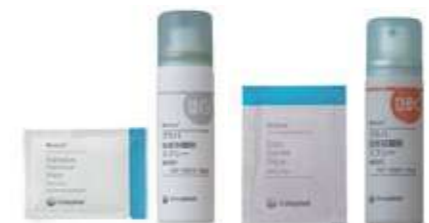
剥離剤と被膜剤の例 (ブラバ皮膚被膜剤・ブラバ粘着剥離剤)

通常より1日早く交換するか、 肌を守るために被膜剤を付け ておくのもよいと思います。ま た、装具の交換頻度が高くな ると、剥がす時の肌への刺激 も増えますので、剥離剤を使っ て、肌の負担を軽くしてあげる ことも重要です。