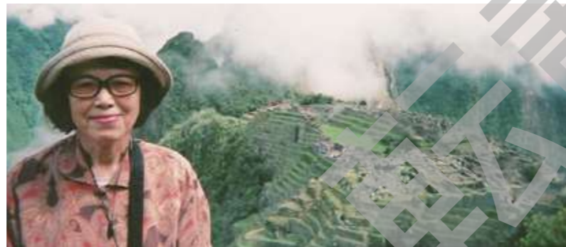
世界遺産 マチュピチュにて

と、この年の3月末日をもっ て退職しました。ただ、代わり の見つからない授業が1つあ り、1年間は主人に車で1時間 半の道のりを送り迎えしてもら い、週1回勤務しました。この 時が一番辛かったですね。